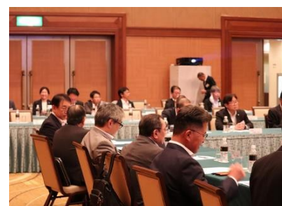
全郷心会会長 専務理事