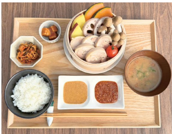
国産鶏と季節の野菜のせいろ蒸し

た場所にはお風呂用の万田発酵入り足湯があり、足湯に浸かり海を眺めてゆったりすると癒される時間になります。またヤギやラブラドルレトリバーも畜産用やペット用万田発酵で生育されており、ふれあい体験ができます。もちろん広い施設の中には遊具も整備されており、ご家族で楽しめます。