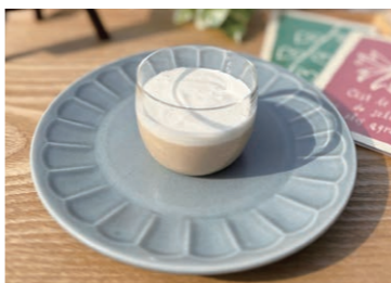
紅茶のパンナコッタ

また、グルメなカフェがエクスOゲートにございます。時期によりメニューは変わりますが、お薦めは「からだが喜ぶ」発酵ランチです。塩麹に漬けた鶏肉と様々な野菜をせいろ蒸した発酵食品が盛りだくさんです。食後のデザートは紅茶のパンナコッタが一押しのものです。