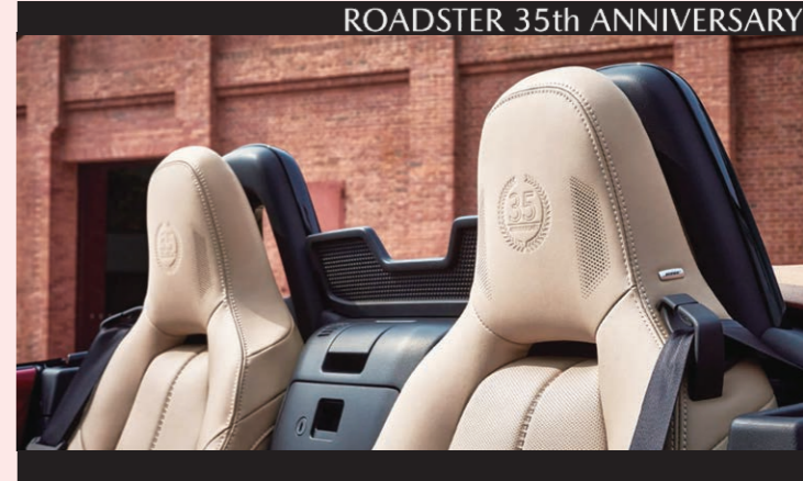
ROADSTER 35th ANNIVERSARY