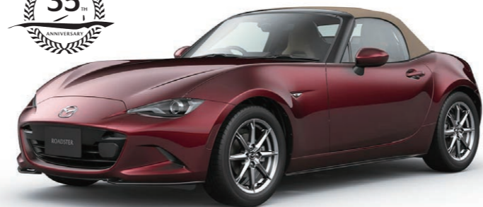
ROADSTER 35th ANNIVERSARY