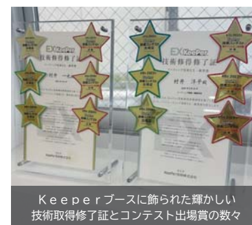
Keiperブースに飾られた輝かしい技術取得修了証とコンテスト出場賞の数々

村井石油株式会社はKeiper認定店舗ですが、認定にはKeiper技術者が在籍すること及び一定の施工環境の整備が必要となります。通常は給油所の一角での施工が多いのですが、当社