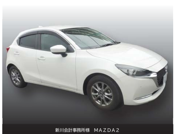
新川会計事務所様 MAZDA2