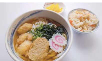
●たこ天じゃこ天うどんとあさり飯セット 1,000円(税込) たこ天とミニじゃこ天が入ったよこばりうどんに自家製あさり飯がついた人気のセット。

当日、頂いた名刺には「私たちの会社は、『しまなみ海道をご利用いただく方々の素敵な思い出づくりをお手伝いする』会社です。」と記されていました。これは、人や物を運ぶだけでなく、旅の思い出をつくることに協力する、という旅客船事業の精神を表す言葉ではないでしょうか。 また、大浜パーキングエリアの特長をお聞きますと ①しまなみ海道最初のパーキングエリア ②上下線を歩道橋での行き来が可能 ③橋(因島大橋)からの距離が近い この3点を挙げられました。普段私たちは