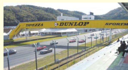
開催場所：岡山国際サーキット

因島郷心会では、11月10日(日)に尾道郷心会と合同で「マツダファンフェスタ2024 イン岡山」参加ツアーを因島4会員14名様(全体15会員36名様)で開催いたしました。