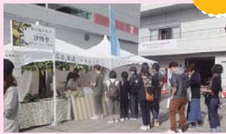
宮島さん因島水軍花火大会