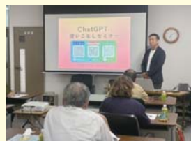
開催場所：因島商工会議所