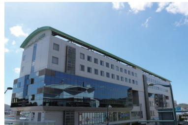
尾道ウォーターフロントビル