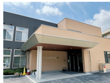
2022年4月オープン ナースングホームごおう

【お問い合わせ】(住所) 〒721-0971 福山市蔵王町 162 番地 1 (TEL) 084-941-6888 (FAX) 084-941-6456