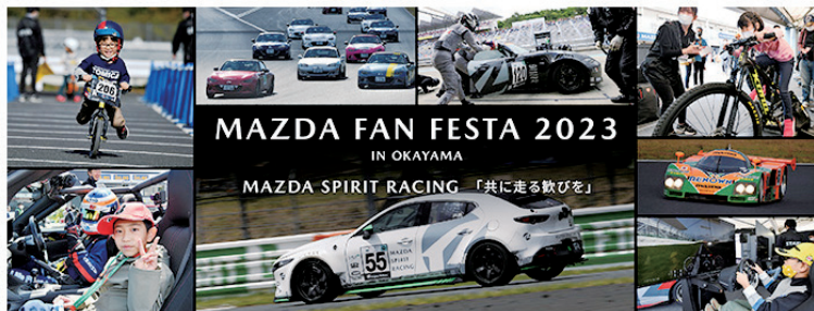
「MAZDA FAN FESTA 2023 IN OKAYAMA」(イメージ)

福山郷心会では、11月5日（日）の見学会バスツアーを企画・ご案内しています。是非お誘いあわせの上、ご参加ください。