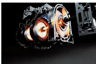
e-SKYACTIV R-EV電動駆動ユニット

－ カーボンニュートラル実現に向けて、生産工程における環境負荷低減の取り組みを推進 －