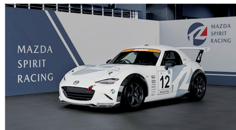
MAZDA SPIRIT RACING ROADSTER CNF concept (12号車)

同時にモータースポーツでカーボンニュートラルに取り組むことで、将来にわたって持続可能な社会のあるべき姿を創造し、時代の変化に適したモータースポーツ活動の啓発、認知拡大に務めています。