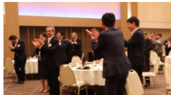
全郷心会会長 & 専務理事 との交流会開催

5月29日(水) 広島にて、14各郷心会の会長・専務理事、副知事、マツダ(株)青山専務他出席のもと「会長会議」を開催。前年度活動の報告、今年度の事業計画を審議/承認する場となりました。今年度は、新たに「BUYひろしま活動を通じて、郷土愛を育み、自ら郷心会とマツダを推奨するファンを増やすこと」で、 広島経済活性化に貢献していく という郷心会のミッションを追加設定し承認を受けました。