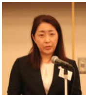
広島県 玉井副知事