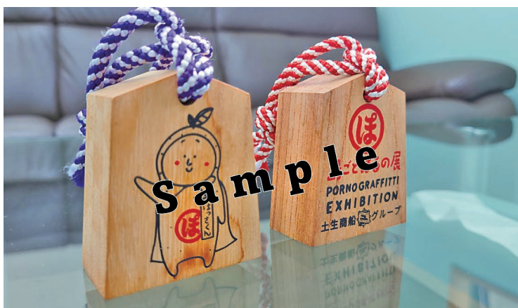
島ごとぼるの展とコラボした乗船手形とポストカード

先ず、7月20日の「いんのしま水軍花火大会」開催日では、市の中央駐車場屋上にて土生商店街エリア限定で聞ける広島FM [HAVE A NICE RADIO]の花火にあわせてセレクトしたポルノグラフィティの楽曲を楽しむことができます。当放送は21日、