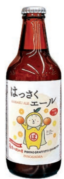
はっさくエール 島ごとぼるの展 限定バージョン

吉徳屋様では、地元クラフトビール「はっさくエール」を販売しておりますが、この7月20日からは「はっさくエール島ごとぼるの展バージョン」が期間限定で発売されます。