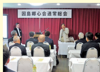
開催場所：ホテルいんのしま

6月6日(木)に2024年度因島郷心会通常総会を参加者57名様で開催いたしました。議事は①2023年度事業報告および収支決算報告について②2024年度事業計画(案)および収支予算について③役員改選(継続就任のご承認)(案)について全て承認されました。引き続き行われました懇親会では、初めて参加の会員様も複数居られ、会員相互の交流を深められました。