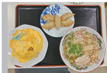
島ごとぼるの展コラボメニュー

〒722-2102 尾道市因島重井町小田浦5221-17 営業時間 11:00~14:00 17:00~21:00 定休日 水曜日、臨時休業有り TEL:0845-23-7031