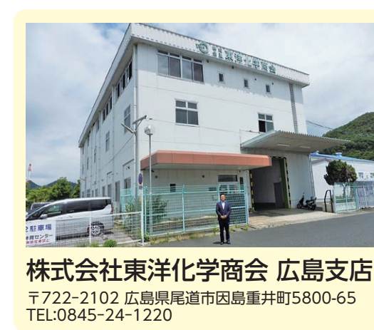
株式会社東洋化学商会 広島支店 〒722-2102 広島県尾道市因島重井町5800-65 TEL:0845-24-1220

本社は東京にビルを建てておられますが、因島に縁があります。創業者が田熊町のご出身で、印刷会社に必ずあります断裁機の防錆剤を製造・販売するために東京で会社を立ち上げられました。(株)東洋化学商会様の製造された錆止めで使うシリコンスプレーは、日本で最初のシリコンスプレーだそうなんです。 事業拡大の中で西日本を管轄する営業と工場の機能を郷里の因島につくられたのが、今の広島支店の元となります。 (株)東洋化学商会様の商品は以前からマスコミで取りあげられることも多く、例えば「ラストブリザード」という商品は、錆他で不動となったボルト等を冷却材を吹付け金属を収縮させ、隙間にオイルを浸透させて緩ませ動かせるもので「がっちりマンデー」というテレビ番組でも紹介されました。