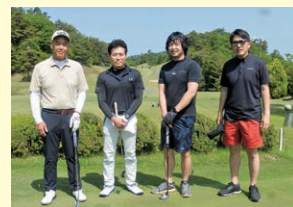
開催場所：尾道カントリークラブ宇根山コース

5月26日(日)に因島・尾道・三原郷心会と合同で「設立30周年記念チャリティゴルフコンペ」を尾道カントリークラブ宇根山コースで開催いたしました。参加者は全体21会員49名因島郷心会は9会員15名の会員の皆様に参加して頂きました。高低のある起伏に富んだコースでしたが、当日は天気も良くナイスショットも多く出ていました。参加された会員の皆様には3郷心会から様々な、会員商品をお渡しさせて頂きました。また、チャリティ募金は参加者全員にご協力頂き、尾道市社会福祉協議会へ納付いたしました。