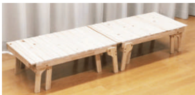
横幅54~90cmの間で伸縮可能