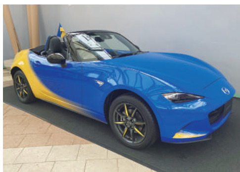
特別塗装を施した現行「マツダロードスター」

会場の展示車両「GB型三輪トラック」イラストに極めて忠実なくすんだ赤色に塗り替え、当時の復興への思いを力強く伝えた。