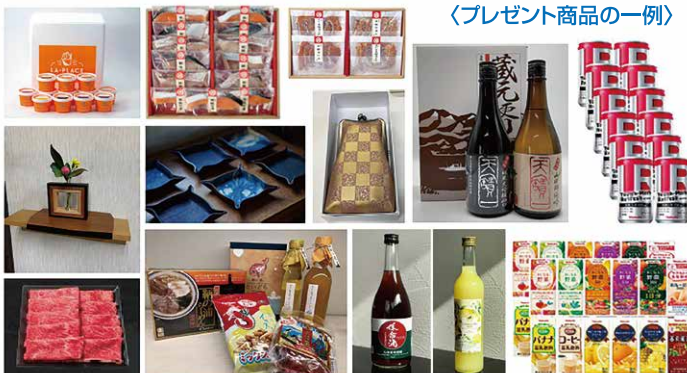
〈プレゼント商品の一例〉

令和4年1月に福山郷心会5千円商品プレゼント企画を実施し、会員の皆様へ福山郷心会会員製品をお届け致しました。今回はどんな商品が届くかは来てのお楽しみで、45会員様から、工芸品・海産物・お酒・ジュース・アイスクリーム・コーヒー・柑橘・お菓子等、様々な商品でご参加頂きました。たくさんのご感想を頂きましたので、いくつかご紹介致します。