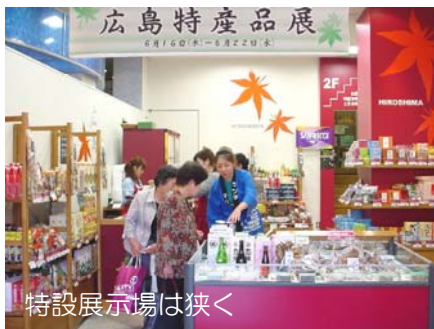
特設展示場は狭く

特設展示場は、それに伴い、売り場面積が縮小され、出展品目を絞らざるを得ない状態となった。しかし、レジ業務が一本化され、売上管理などのわずらわしさから開放された。出展品目については、常設展示の品物とのバッティングを避け、特長のあるものが望まれる。また、通りがかりのお客さんの買いどころは600円以下のものようだ。また、今回から販売スタッフを東京の若い女性に応援をお願いしたため、売上也伸びてきた。引き続き、11/17(木)から1週間、「広島特産品展」を開催する予定です。