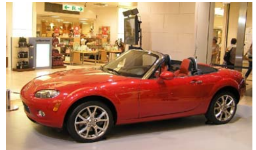
広島そごうに展示された「新型ロードスター」

コンセプトは、「歓びにあふれた躍動するデザイン・卓越したモダンスタイリング」、開発コンセプトは、「人馬一体」とそれによって得られる「Lots of Fun」です。この商品コンセプトを実際のクルマで実現するための重要な要素は、「パッケージング」です。それには、①軽量・コンパクトなボディ ②適度にタイトな室内空間 ③フロントエンジンとリアドライブ ④ダブルウィッシュボーン・サスペンション ⑤パワープラント・フレームのあわせて5つの要素があります。この5つを持ったクルマは、世界に類を見ないロードスターだけの特徴なのです。各郷心会では、会員の皆様に体感していただくため、持ち回りでデモカーを用意します。ぜひその走りを味わってください。