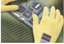
ハイパーグリップス

TEL. (0846) 26-0021 http://www.atom-glove.co.jp