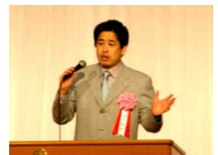
二宮 清純 氏

7/12(火) 広島プリンスホテルにおいて、広島郷心会の総会が開催された。総会に先立ち、スポーツジャーナリストの二宮清純氏の「勝者の思考法」と題して講演会が行われた。大ホール一杯の聴衆を前に、「広島東洋カープの1ファンとしてカープの目指してほしいこと。阪神の4番・金本とカープ4番・新井とのデータの比較によってOUTから遠ざかる秘訣。サッカーJリーグ発足当時の川淵キャプテンの決意。出来ない・前例がないでは前に進まない。企業においても勝者となるためには、SKILL(技術)よりWILL(何をやりたいか)が大事。SKILLはそれに伴ってついてくる。ONLY1がNO.1になる。」などスポーツを通して「勝者となるための秘訣」を話された。経営者として有意義な示唆に富んだ講演であった。講師の二宮氏は、後の懇親会にも出席され、秋葉広島市長・宇田広島商工会議所会頭・井巻マツダ社長などと親しく懇談された。