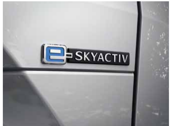
「MX-30」 e-SKYACTIV バッジ

また、より安心してカーライフを過ごしていただけるように、コネクティッドサービスとスマートフォン専用アプリ「MyMazda」が連携し、バッテリーの状態確認や充電し忘れ通知、出発前のエアコン操作など EV だからこそその機能を充実させました。