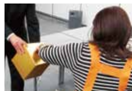
<厳正なる抽選風景>