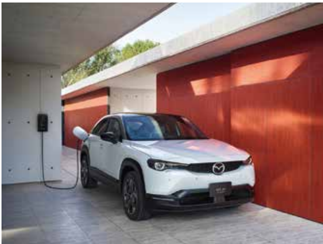
「MX-30 EV MODEL」 EV Highest set (ハイエスト セット) 2WD

EV 専用に基本骨格、ボディを強化したマツダの新世代車両構造技術「SKYACTIV-VEHICLE ARCHITECTURE（スカイアクティブ ビークル アーキテクチャー）」と、電動化技術「e-SKYACTIV（イースカイアクティブ）」により、思い通りに操れる走行性能と、様々なシーンで体感いただけるシームレスで滑らかな挙動を実現しました。搭載するバッテリーは、LCA 評価による CO 2 排出量を抑えることと、買い物や通勤など、日常生活でのお客様の実用的な使用環境に見合った走行距離を考慮し、総電力量 35.5kWh としました。マツダの安全思想に基づいた先進安全技術「i-ACTIVSENSE（アイ・アクティブセンス）」を標準装備とし、全機種が「サポカー S・ワイド」に該当しており、サポカー補助金の対象です。