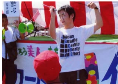
[安芸] ふれあいの夏まつり 7/29