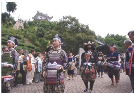
[因島] 水軍まつり(島まつり) 7/22