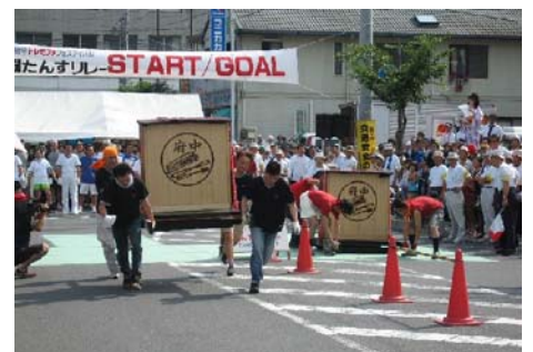
[府中] ドミファ フェスティバル 7/23