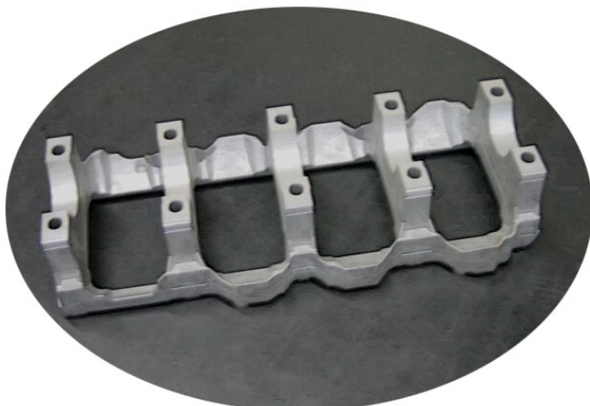
「アテンザ等の1.8~2.3Lの車」へ搭載の『ベアリングビーム』 (シリンダーブロックの下側の部品)

また、新型モーターの開発や使いやすさの追求によって、軽量化・コンパクト化を実現した電動工具や園芸用機器などのパワーツール、独創的な機構による高性能化と優れた耐久性のドアクローザなどの建築用品を提供しています。