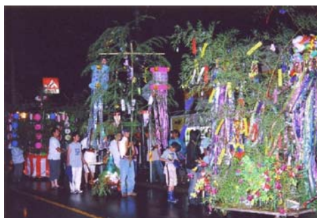
[庄原] 高野七夕祭 8/5