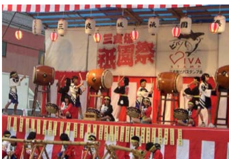
[三次] 三良坂祇園まつり 7/8

今年の夏は特に暑い夏でした。その暑い夏を吹っ飛ばすように、各地で夏祭りが繰り広げられました。花火大会・灯籠流し、盆踊りなど風流で趣向を凝らした祭りです。郷心会もこれに協賛し、イベントへの協賛金やマツダ車展示などで祭りを盛り上げました。