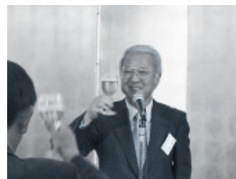
大田会頭 乾杯挨拶