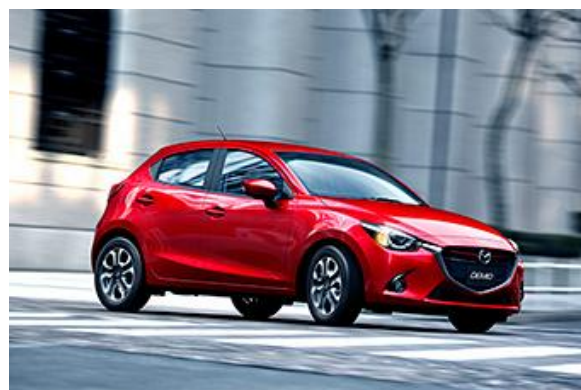
新型「マツダ デミオ」(日本仕様)

搭載するエンジンは、2.5L ガソリンエンジン並みのトルクフルな走りと優れた燃費・環境性能を両立する新開発の小排気量クリーンディーゼルエンジン「SKYACTIV-D 1.5」のほか国内市場には「SKYACTIV-G 1.3」を導入する予定です。