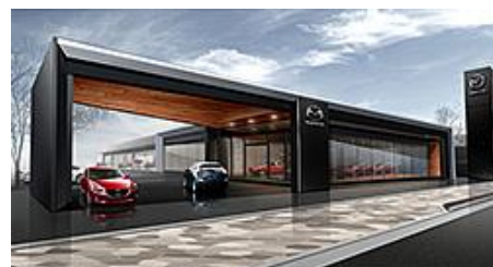
新世代店舗 外装(イメージ図)

マツダ(株)(以下、マツダ)は、7月31日(木)、お客さまにマツダの魅力を感じていただくために、新しいコンセプトの販売店(以下、新世代店舗)を順次展開することを発表しました。この新世代店舗を、国内市場におけるマツダブランドの発信・体験拠点として、お客さまとのさまざまな接点を通じ、お客さまの人生をより豊かにし、お客さまとの間に特別な絆を持ったブランドになることを目指していきます。