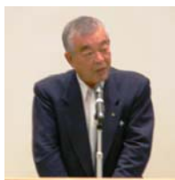
藤井福山郷心会会長

の紹介に続いて、フリードマン代表取締役専務執行役員が会社代表挨拶。ピアンテ紹介のビデオの後、看取りを行った。会場内のピアンテの周りは、室内の広さを確かめる人、エンジンルームを見る人など多くの人が押しかけ、盛況だった。