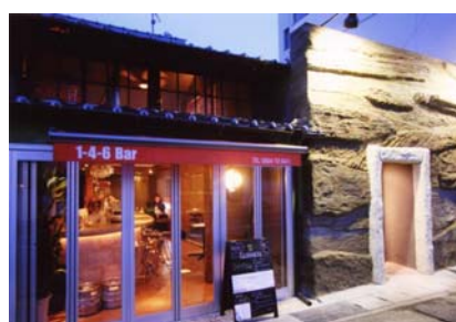
地層をイメージした店舗外観施工