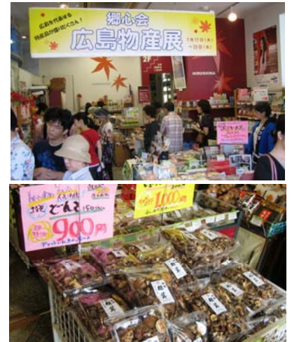
一番人気の「干し椎茸」

7/17(木)～23(水)の1週間、恒例の郷心会連合会主催、広島物産展を、東京新宿駅南口の広島県のアンテナショップ「広島ゆめてらす」で開催しました。今回は、7郷心会15会員から選りすぐりの商品を出品して頂きました。開催期間中に関東地方の梅雨明けが発表されたこともあり、猛暑・酷暑の中での開催でしたが、多くのお客様にご来場頂き、特に3連休には店内に入り切れないほどの盛況でした。今回一番の人気は、今日屋様の「干し椎茸」で、多くの方が買い求められました。また、今回から出品会員様の事前取材活動を行い、生産現場や収穫作業をビジュアルに説明したことにより、お客様へのアピールが一段と出来たと思います。特に有田園芸様の「赤土じゃがいも」、天野実業様の「具たくさん野菜スープ2種」や、イブリック様の「有機ドリップコーヒー」は、試食・試飲を積極的に行い、「生産者のこだわり」を来店された方々にアピールできました。