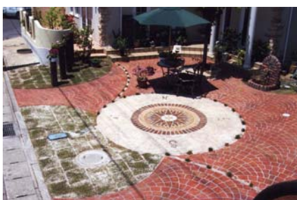
S氏邸 パティオ施工

この「特殊造形モルタル」の特性を、お客様のご希望、イメージに沿って、空間にインパクトや感動、癒しなどの効果をデザイン画の形に表現して提案させていただきます。空間創りのデザイナーとしては、様々な要望に応えられるように、実際に現地(国内及び海外)へ行き、風景や建築物から伝わってくる心地よさの感覚を大切にしています。これからも「あなたのイメージを形に・・・」をモットーに特殊造形モルタルの可能性を大きく広げていきます。(ホムゾ http://www.ikiikiya.com)