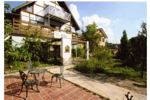
IKIコーポレーション店舗外観

特殊造形モルタルとは、アミューズメントパークなどにある、擬石、擬岩、擬木をはじめ、巨大な山などを製作するための材料で、発想次第で無限の空間を演出できます。この工法を一般の住まいや庭、店舗に取り入れる事で、より個性的な空間創りを目指しています。事務所の隣では、カフェと雑貨店も運営していて、空間デザインの一部を楽しんでもらえるスペースにしています。