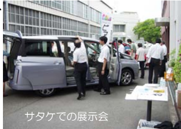
サタケでの展示会

東広島郷心会では、新型ピアンテをメインに、7月末まで連日にわたり、㈱サタケ、中国電力㈱東広島、中央工業㈱をはじめ延べ11社で職域展示会を実施した。猛暑にも拘らず、大勢の皆さんが来場され、新型ピアンテに見て、乗って、触れただけでいい。ピアンテは、5月連休以降のティザーキャンペーンの効果もあり認知度も高く、室内の広さとシートアレンジに関心が集まった。郷心会としても、販売会社と共に、会員への販促活動を継続したい。