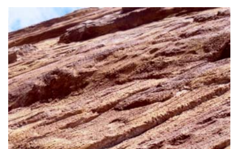
左写真の施工壁面の拡大写真