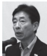
寄谷商工労働局長