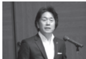
毛籠常務執行役員

尚、この講演会では、メディア各社による取材が行われ「広島郷心会」の存在アピールにも繋がりました。