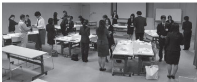
ビジネスマナー講習会

通常総会・懇親会、ビジネスマナー講習会、カーブ観戦会、企業見学会、空港見学会、牧場体験会、チャリティゴルフコンペ、各種講演会など。