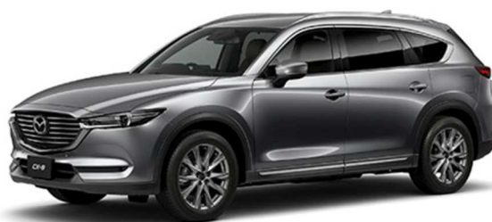
「マツダCX-8」(XD L Package)

新型『マツダ CX-8』は、30代から40代を中心に、幅広いお客さまからご支持をいただいています。お客様の声としては、「多人数乗車を可能としながら、かっこよさを感じる」「乗り心地の良さや静粛性は想像以上」や、「3列目は座り心地も広さも十分」など。加えて、マツダの先進技術「i-ACTIVSENSE(アイ・アクティブセンス)*2」を標準装備化し、経済産業省、国土交通省などが普及啓発を推進する「安全運転サポート車」の「サポカーS・ワイド」*3に全機種が該当していることに対しても、ご支持をいただいています。