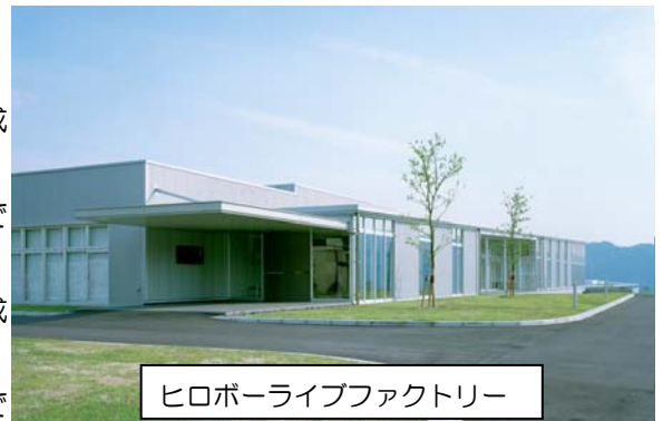
ヒロボーライブファクトリー

産業用無人ヘリコプターでは農地での薬剤散布を行う「RMAX」の製造のほか、送電線等の高所点検作業や有人機が立ち入れない危険区域や災害現場での調査、監視を行う自立航行型無人ヘリコプターの開発を進めております。