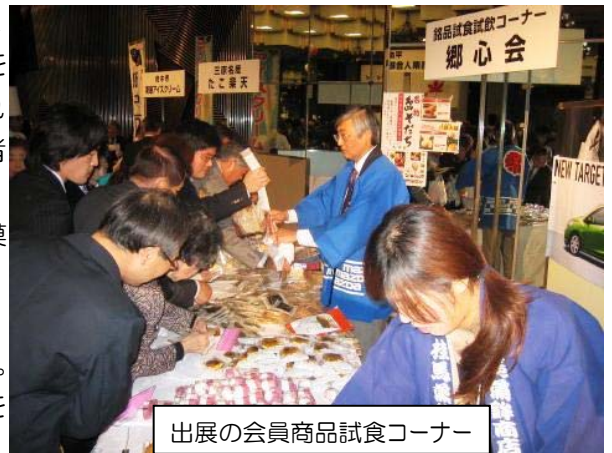
出展の会員商品試食コーナー