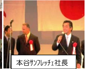
本谷サフレッチェ社長