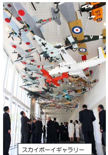
スカイボーイギャラリー