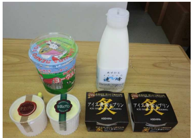
左上:安瀬平連峰ヨーグルト 400g、右上:安瀬平連峰飲むヨーグルト 520ml、 左下:黄金のプリン、左中:伝説のプリン、右下:アイス黄金のプリン

(三次市三和町羽出庭588-1、TEL:0824-52-3735、FAX:0824-52-3926、 http://www.asehira.com/ )