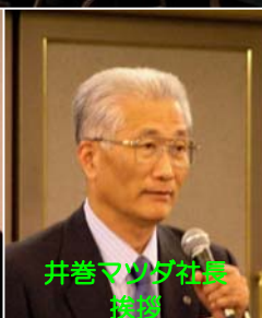
井巻マツダ社長 挨拶