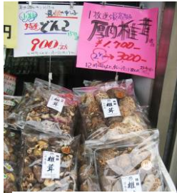
売上No1 乾しいたけ (有)今日屋