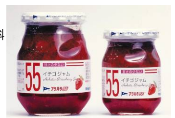
アヲハタ55イチゴジャム