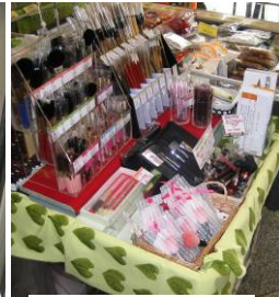
売上No2 化粧筆 (株)一休園