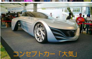
コンセプトカー「大気」

5/3(日)～5(火)、「2009ひろしまフラワーフェスティバル」が平和公園および平和大通りを中心に開催された。33回を迎えた今年は、晴天に恵まれなかったものの、3日間で延べ161万人の人手でにぎわった。郷心会は「マツダ Zoom-Zoom ひろば」(写真左上)の物販コーナーに、大竹郷心会から2会員(イブリック「自家焙煎コーヒー」妹背製菓「最中」)が出店。マツダコーナーに来場されるお客様にコーヒーを中心とした飲み物を販売して祭りを盛り上げた。ひろば中央には2007東京モーターショーに出展したコンセプトカー「大気」が展示され、来場者の注目を集めた。