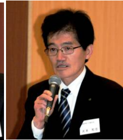
光本商工労働局長