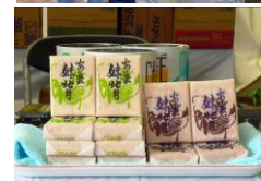
(上) 自家焙煎 コーヒー (左) 最中