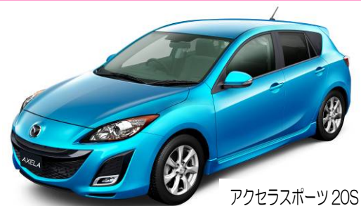
アクセラスポーツ20S

6/11(木)マツダ(株)は、約6年ぶりのフルモデルチェンジとなる新型「アクセラ」を発表。信号待ちなどで停車するとエンジンが自動的に止まり、アクセルを踏むと再始動するアイドリングストップ機能「i-stop」(アイストップ)をFF・2L車に標準装備。停止状態から再始動までの時間を従来他社の半分の0.35秒に抑えるとともに、低燃費を実現し、エコカー減税(75%減税)対象となっている。アクセラシリーズの月間販売目標は2000台。