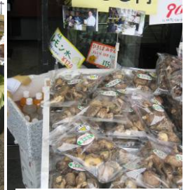
売上No3 乾しいたけ 萬治きのご牧場