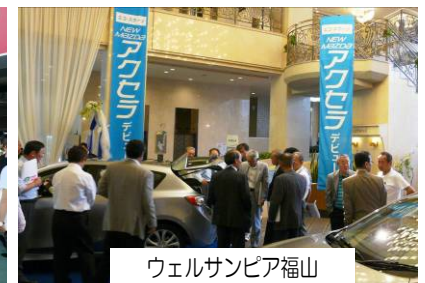
ウェルサンピア福山