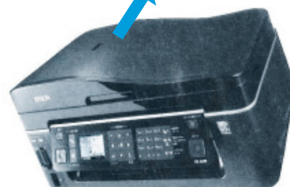
プリンタのシボ加工