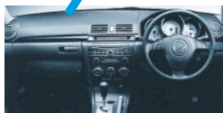
「アクセラ」インパネのシボ加工