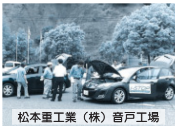
松本重工業（株）音戸工場

新型アクセラ発表に伴い、職域展示会を6月25日から7月31日まで、24社25会場で実施しました。梅雨の合い間をぬい、天候にも恵まれ多くの方に新型アクセラをご覧になっていただきました。i-stop車には、店舗営業スタッフが同乗し、試乗もでき（場所の関係で全展示会場所ではないが）体感していただきました。試乗された多くの方から「発進時もスムーズにエンジンがかかり、違和感を感じない」という感想をいただきました。