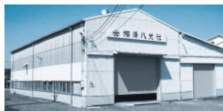
(株)棚澤八光社「広島工場」

エッチング「シボ」の質感をはるかに超えた自然界に存在する模様をそのまま反映できる。経済産業省認定の戦略的基盤技術として開発支援をうけている。