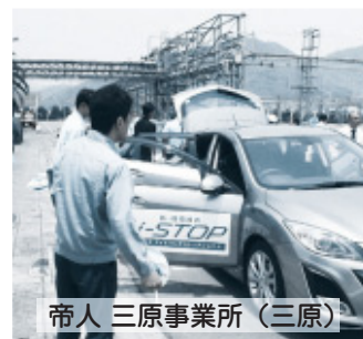
帝人三原事業所(三原)