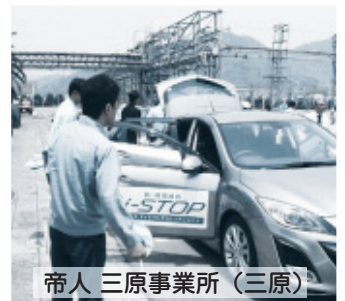
帝人三原事業所(三原)